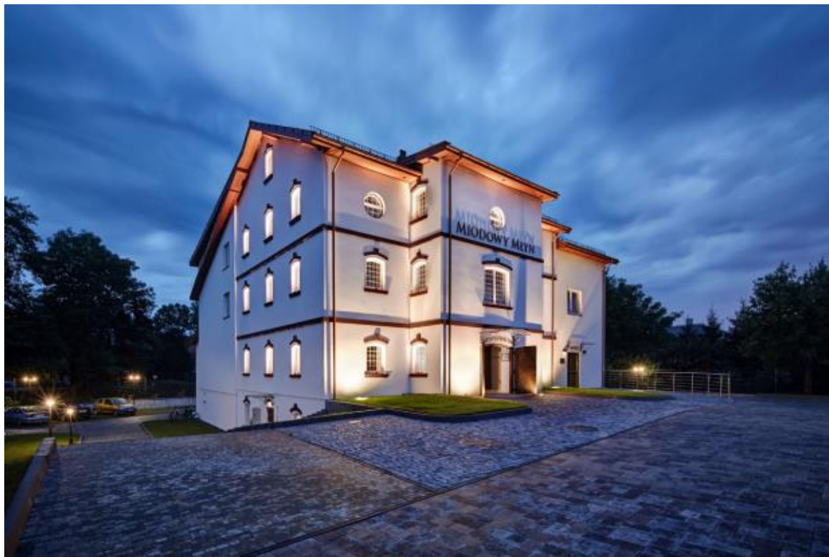
Na zdjęciu: Miodowy Młyn

Przede wszystkim już sam przegląd przyszłego potencjału kadrowego jest bardzo pomocny dla pracodawców. Możliwość obserwacji podczas procesu edukacji potencjalnych kandydatów na pracowników, ich rozwoju, predyspozycji i zaangażowania daje szanse wytypowania kandydatów zgodnych z oczekiwanym przez nas profilem. Współpraca na tym etapie edukacji daje też możliwość realnego wpływu na kształtowanie pożądanych postaw co szczególnie istotne jest w branży turystycznej. Założenia projektu nastawione są na docelowe podniesienie konkurencyjności całego regionu świętokrzyskiego. Ważnym elementem tego działania jest staranny dobór firm odpowiedzialnych za kształtowanie praktycznej części edukacyjnej projektu. Zaproszenie do uczestniczenia w tym projekcie to dla nas nie tylko duża szansa na podniesienie konkurencyjności na tle branży, ale również wyróżnienie i wsparcie w rozwoju.